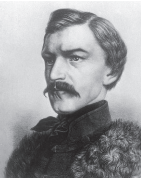
Карел Гавлічек-Боровський (1821 – 1856), чеський поет та публіцист, теоретик австрославізму

на ті часи, система загальної освіти дозволяли витворити тим народам свою першу масову інтелігенцію, а австрійські норми конституціоналізму (в другій половині XIX ст.) відкри-