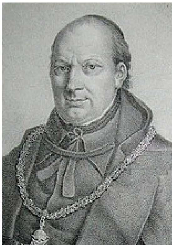
Модест Гриневецький (1756 – 1823), перший галицький патріотичний богослов і культурник, ректор Львівського університету

Другою великою проблемою, через яку загальмовувалося галицьке культурне життя, було описане вище рутенство як певний морально-психологічний комплекс. Воно унеможлиблювало найменші вияви