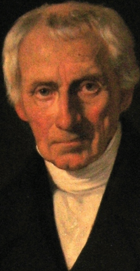
Денис Зубрицький (1777 – 1862), перший професійний галицький історик, член-кореспондент Петербурзької академії наук, теоретик москвофільства

го соціуму, який блукав у потемках від світових ідей, жив «ідеалами» пристосуванства, прислужництва, мімікрії. Тому в російській величній імперській культурі того часу перші москвофіли побачили певну моральну та ідейну компенсацію своїй загальній імморальності та безідейності. Як особистості москвофіли були представниками того вузького прошарку, який зумів стати якоюсь «елітою» в надзвичайно бідному й відсталому галицькому соціумі. Вибившись наверх, вони безмежно зневажали простий народ, бридилися його мовою та звичаями. Їхня навмисна відчуженість від мовної стихії українства носила ознаки певної моральної патології. Тож ці «староруси» (одна з назв цього руху) захопилися за російську мову, як хапається за ліврею пишого аристократа жалюгідний плебей, щоб хоч якось доторкнутися до осяйного «вищого світу». Справжньої російської культури та й мови вони не розуміли, не сприймали передових політичних і філософських ідей тодішньої російської еліти, ставши таким собі закордонним ар'єргардом російського монархізму та реакції.