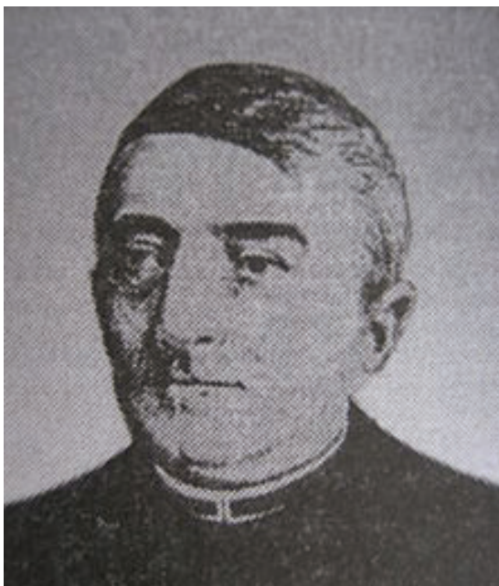
Рудольф Мох (1816 – 1892), автор першої окремої художньої книги українською мовою в Галичині – збірки поезій «Мотиль» (1841)

можна означити 1790-им і 1848-им роками. У цей час, попри відкриті австрійським урядуванням можливості, надсильною була загальна інертність галицького суспільства. Здобуваючи освіту, інтелігенція (а це було в основному духівництво) належно не відкривалася до світу, не жила великими й передовими європейськими ідеями, не займалася активною і творчою просвітницькою працею, не мала громадянської відваги та наполегливості.