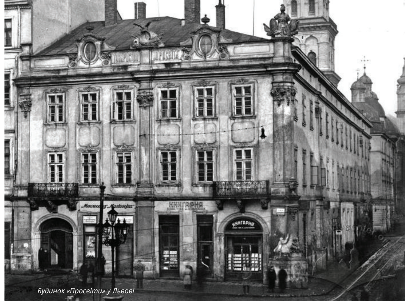
Будинок «Просвіти» у Львові

диціоналізму та націоналізму. Ця еволюція – це один із вирішальних і переломних моментів української історії. Перехід І. Франка на засади націоналізму та громадянського героїзму означав порятунок Галичини від ліво-анархістських настроїв, які так фатально охопили тоді Наддніпрянщину і привели її до катастрофи в Національній Революції 1917–1920 рр. (Про форми, особливості й сенс цієї еволюції йдеться в недавній монографії [3]). І. Франко повів за собою велику частину членів Радикальної партії в право-центристський табір народовців і в 1899 р. була створена єдина й потужна Українська націо-