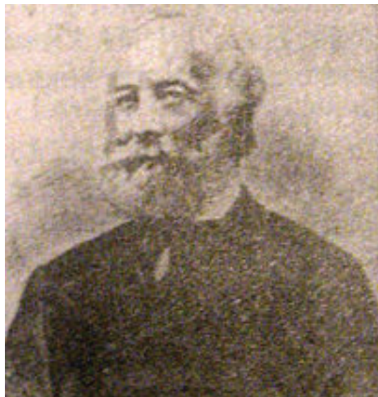
Богдан Дідицький (1827 – 1909)

болото не дійшло йому до горла і не задушило його моральної істоти» [19, с.12-13].