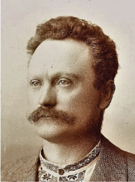
Іван Франко (1856 – 1916), найвизначніший галицький інтелектуал, письменник, ідейний лідер галицької культури й громадсько-політичної думки свого часу, в якому ментальний тип галичанина знайшов своє завершення й найповнішу реалізацію

веренність: Головна Руська Рада, Собор Руських учених, Галичоруська матиця, кафедра руської словесності у Львівському університеті тощо. Галицькі русини своєю окремою делегацією взяли участь у 1-у Слов'янському з'їзді 1848 р. в Празі і цим заманіфестували перед Європою свою національну ідею [2].