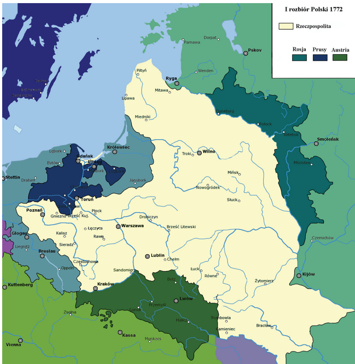
Перехід Галичини під владу Австрійської імперії після першого поділу Речі Посполитої 1772 р.

ша тверезість та еластичність у суспільних стосунках. Кульмінацією в розвитку суспільного типу галичанина М. Шлемкевич вважає Петра Сагайдачного-Конашевича, першого великого козацького гетьмана, прагматичного політика, далекоглядного стратега, людини раціональної і виваженої. Його антитезою є Богдан