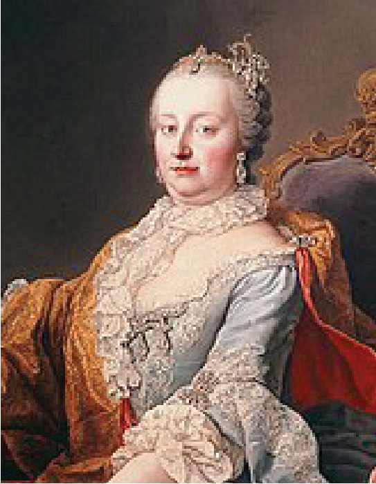
Австрійська імператриця Марія-Терезія (1717 – 1780), правила від 1741 р., авторка прогресивних реформ в Австрійській імперії, за неї Галичина перейшла під владу Відня, були витворені перші правові основи для руського / українського культурного та національного відродження

них «малих» ненімецьких народів. Оскільки імперія складалася з різних етнічних країв – Чехії, Словаччини, Угорщини, Словенії, Хорватії, Північної Сербії (Воєводини), румунської Трансильванії, Південної Польщі й трьох українських (русинських) країв, названих вище, то нова бюрократична система мимовільно стала стимулом для формування національних інтелігенцій цих бездержавних народів.