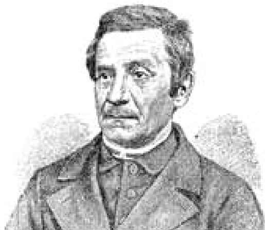
Іван Гушалеви́ч (1823 – 1903)

високе та поважне, хоч насправду висловлював лише бездонну духову мізерію ... Се був перший голос реакції, що, мов темна хмара, висіла над розбурханим обрієм 1848 р., гімн рутенського фарисейства, що під шумними фразами любить ховати зовсім не блискучі, дрібні, самолюбні та брудні заходи, того самого рутенства, що підняло у нас свою голову і швидко показало себе силою, забруднило та висмоктало народний рух і верствою рідкого болота покрило всю історію Галицької Руси на довгі десятиліття. Сам Гушалеви́ч був одним із пильних продуцентів і одною з жертв сього болота. Для нього особисто був у тій ролі певний трагізм, остільки, що коли інші старалися фруктифікувати сей чисто галицький продукт, вивозити його на заграничні ринки, де був попит, де платили за безхарактерність, ренегатство та шпівство, зразу у Відні, а далі в Петербурзі й Москві вижебрували для себе посади, пенсії, пособія та дарунки, Гушалеви́ч служив поганій справі зовсім безкористовно, доки