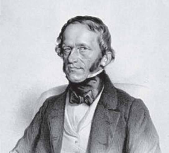
Франтишек Палацький (1798 – 1876), видатний чеський історик та ідеолог національного відродження, теоретик австрославізму.