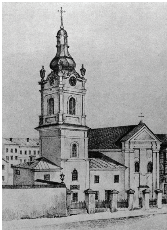
Львівська греко-католицька духовна семінарія при церкві Святого Духа

героїки в суспільстві, притлумлювало його ідейний поступ. Суспільство розвивалося не за законами ідейно-емоційних поривів, як це було в інших бездержавних народів, що боролися за національне утвердження (насамперед італійців, греків, угорців, румунів, сербів, та ін.), а за логікою пристосуванства й лояльності. У таких умовах апріорі не могли формуватися сильні й творчо налаштовані особистості та лідери. Саме рутенство стало тією соціальною основою, на якій постав галицький літературний романтизм. Про його особливості дуже проникливо й цікаво сказав знаменитий галицький критик початку ХХ ст. Микола Євшан. Він, посилаючись на думки відомого чеського славіста Матія Мурка про те, що слов'янські романтики майже винятково наслідували передусім творчість авторів німецької романтичної Швабської школи, релігійних консерваторів і політичних реакціонерів, й наслідували переважно тільки форму їхньої творчості, пояснював так ментальні основи, які визначали й галицьку культуру початку ХІХ ст.: «Перш всього се був рух елементарний, не внутрішня потреба перевороту в світогляді та житті, а більше літературні, книжкові впливи, які тільки в дальшому розвою стали конкретними та більш-менш живими... Я би боявся назвати се пробудженням національної свідомості... Вона була занадто літературною, мертвою, щоб захопити цілу людину, весь світогляд. Само прославлення народної мови й пісень і писання