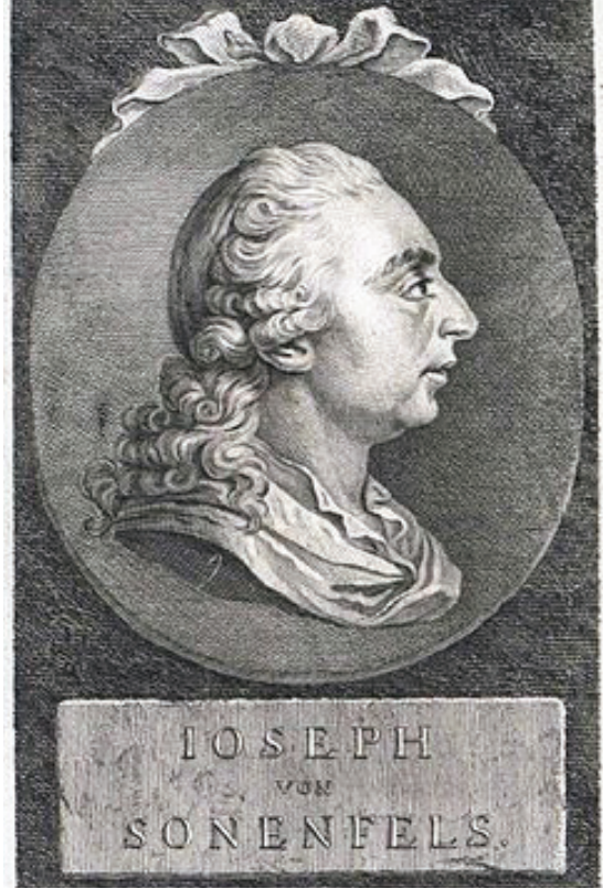
Йозеф Зоненфельс (1732 – 1817), австрійський юрист та економіст, теоретик і учасник просвітницьких реформ в Австрійській імперії

Власне, в цьому полягав основний корінь пізнішого австрославізму – політичної теорії й ідеології, батьками якої були чеський письменник і публіцист Карел Гавлічек-