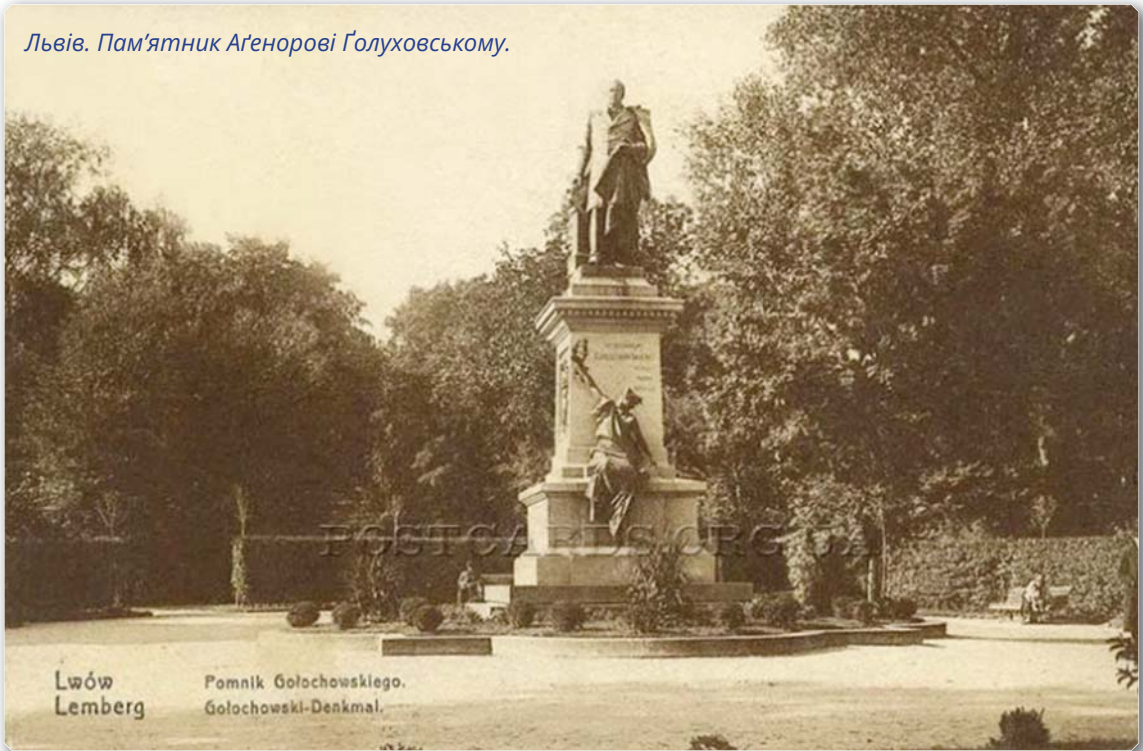
Львів. Пам'ятник Аґенорові Голуховському.

ного письменства, несогірший науковий рух, початки серйозної політичної гадки, початки серйозної роботи коло духовного й почасті економічного подвигнення народних мас, прояви політичної самостійности й активности у наших народних мас (що доперва в останніх роках дали себе серйозніше знати) – все се результати не остатніх навіть десятиліть, а остатніх років минувшого століття. В нове століття ми переходимо в початках нашої національної (не етнографічної тільки) свідомости, в початках нашої національної роботи – се й оправдує наші надії на се будуще століття ... Останні роки показали дуже добре, що свідомість і одушевлення ідеєю можуть дуже багато зробити навіть при найбільших перешкодах і дуже слабих силах. В