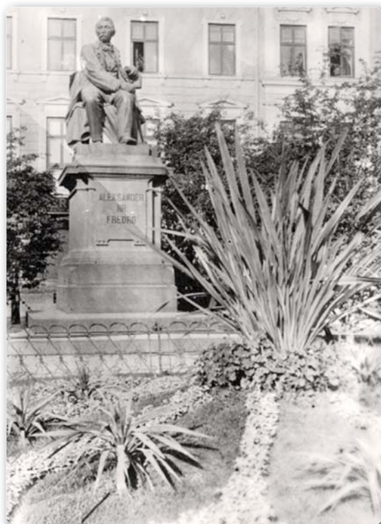
Львів. Пам'ятник Александрові Фредро.

соціальні верстви, нові вікові та гендерні групи (тоді почала розвиватися повноцінна жіноча преса). Загалом на межі XIX – XX ст. українська національно-демократична преса в Галичині цілковито переважила москвофільську і це поведло до повної поразки цього ренегатсько-провокаторського табору, він змалів і здеґрадував.