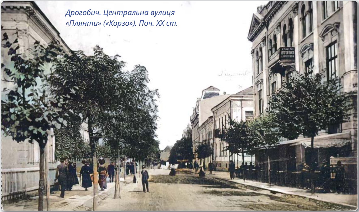
Дрогобич. Центральна вулиця «Плянти» («Корзо»). Поч. XX ст.

них свою політику; ... воно легітимізувало український рух, робило українців формально рівним гравцем на австрійській політичній сцені. По-друге, «станьчики» демонстрували принципову готовність шукати порозуміння з українцями; визнавали національну життєздатність українства... По-третє, втримували в своїх руках ключові важелі управління Галичиною, мали міцні позиції у Відні; лідери «станьчиків» були яскравими особистостями наукового і політичного світу ...» [13, с. 123].