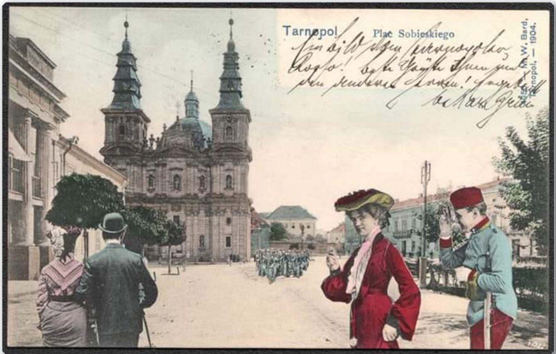
Тернопіль. Площа Я.Собеського. Поштівка. Поч. XX ст.

С. Пахолків продовжує: «Ці юристи розробили і залишили своїм молодшим колегам та наступникам особливий етос і стиль роботи. Поєднання професійної діяльності із суспільною та політичною активністю, відчуття морального обов'язку перед своїм народом єдало їх сильніше, ніж програми і доктрини їх молодих ще політичних партій... У цій атмосфері у східногалицьких повітах з'являлися групи активістів, які гуртувалися довкола яскравих особистостей, переважно адвокатів і священників» [15, с. 344]. І тут автор називає такі імена головних подвижників: Теодор Ваньо в Сколе та Золочеві, Антін Горбачевський в Чорткові і Дрогобичі, Андрій Чайковський у Бережанах, Дем'ян Савчак у Бор-