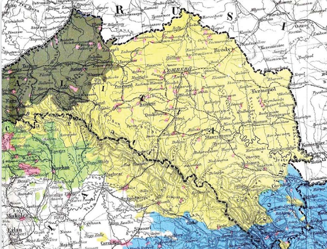
Русинська людність Австро-Угорщини. Карта. Берлін. 1882 р.

перейняте ренесансними спорадичними настроями в добу Великого князівства Литовського. Ця ортодоксально-православна еліта посилено працює над пізнанням своїх духовних глибин, візантійської богословської мудрості та писемності. В Україні з'являється певний культ грецької мови, грецьких словесних образів та літературних особливостей. Відтак зароджується ідея єдності православного світу як якоїсь альтернативи латинському Окцидентові.