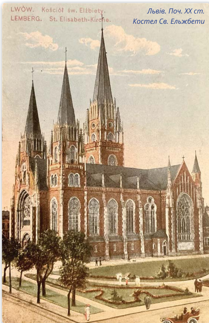
LWÓW. Kościół św. Elżbiety. LEMBERG. St. Elisabeth-Kirche.