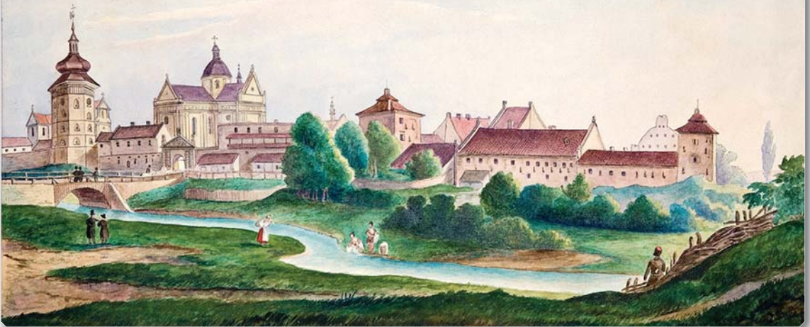
Я.Яворський. Жовква (XIX ст.)

років, до щоденної наступальності супроти поляків і творчого урізноманітнення та вдосконалення в культурі, чим він зажив від 1880-х років.