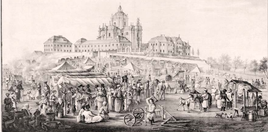
Собор Св. Юра у XVIII ст. Літографія.