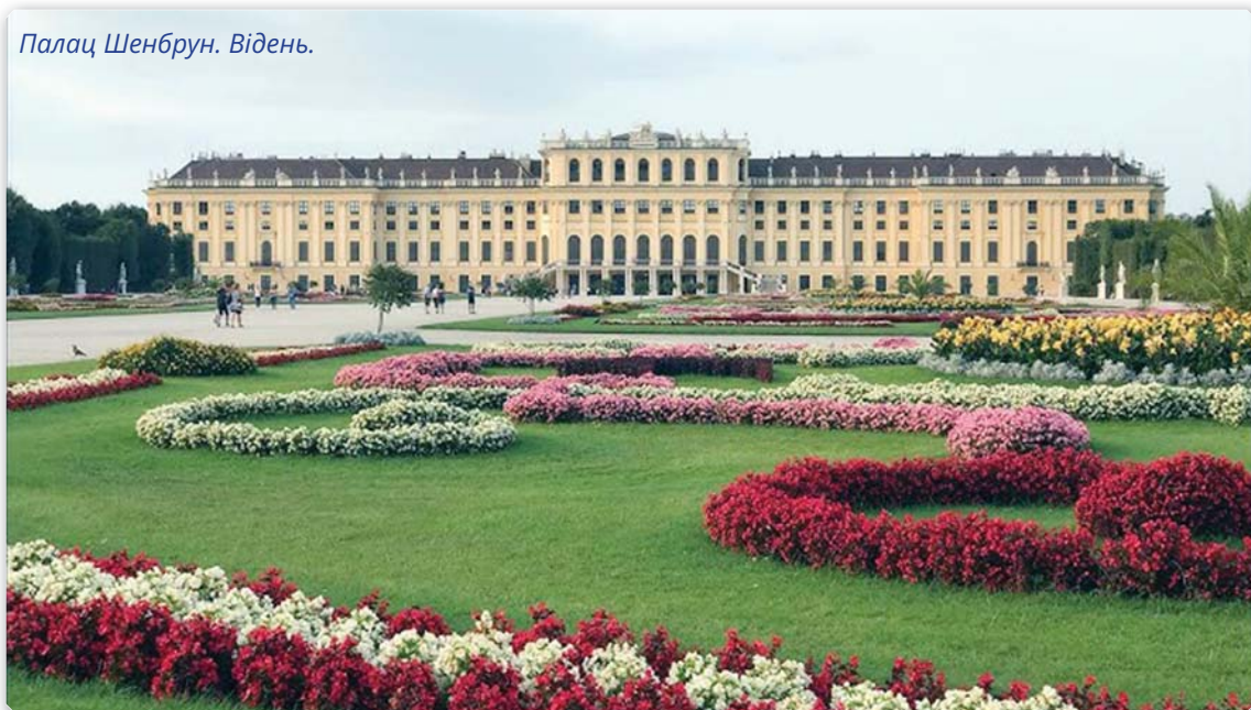
Палац Шенбрун. Відень.

Додаймо, що упродовж попередніх років своєї парламентської