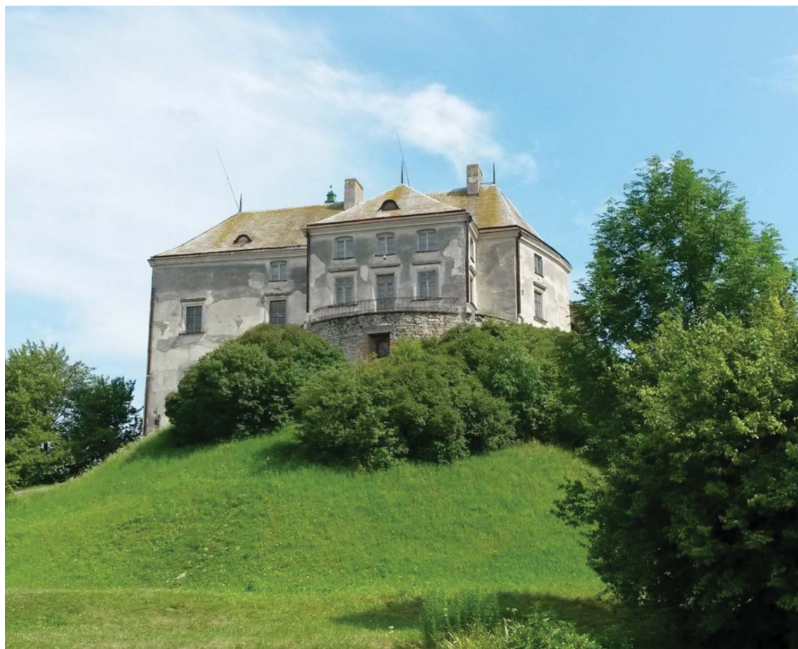
Замок в Олеську

Наперед важні огляди географічно-стратегічні. Для російського державного організму на просторі від Варти по Прут є Галичи-