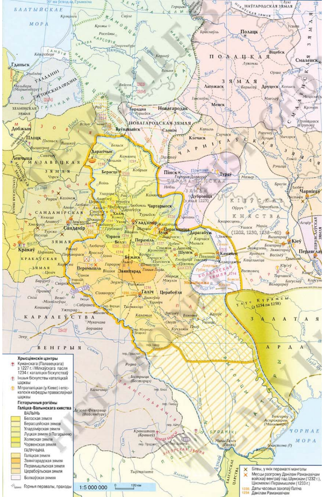
Галіцка-Волинське князівство у XIII ст. за «Гістарычны Атлас Беларусі. Т.1. Варшава-Менск, 2008.