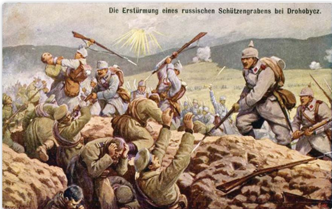
Австрійські війська під Дрогобичем штурмують окопи росіян. Листівка. 1914.

З підпиранням української ідеї й бажанням її використати против Росії нерозлучно мусіло б бути зв'язане особливе дорожіння самим краєм, як западними воротами. В дійсності, що ми бачимо? Глянувши на карту Європи, переконуємося, що як і з одного боку мало побачимо таких природою необезпечених границь, як має Галичина від півночі і сходу, так і з другого боку таки зовсім не побачимо другого такого краю, де б людська штука так мало подбала про вирівняння недостач природи, як саме в Галичині. На 80 тис. км 2 і 8 міл[ьйонів]